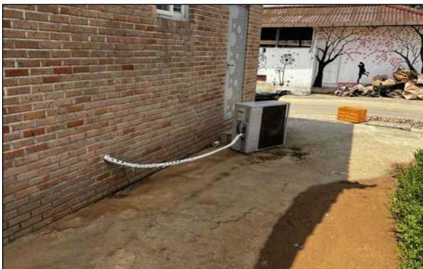
지면과 동일한 위치 실외기(당초)