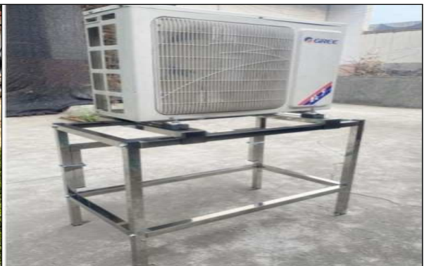
실외기 위치 조정(개선)