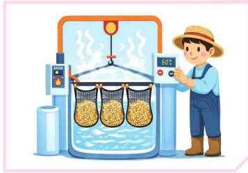
물 온도 60°C에서 10분간 담그기 * 비율 : 20kg당 물 200L