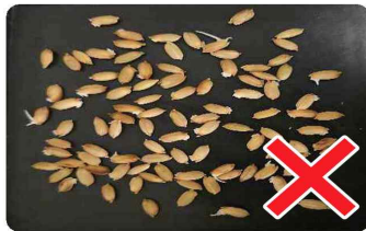
최아율 50~60% / 파종하면 안됨