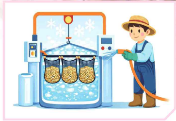
찬물에 10분 이상 식히기