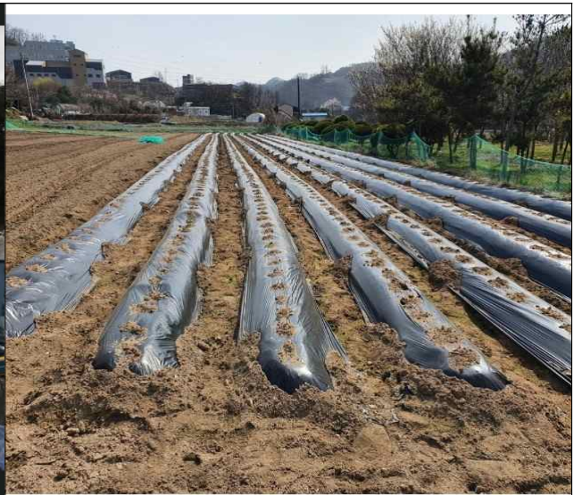
멀칭비닐(모든색상 수거 가능)