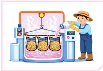
소독약액 24~48시간 침지 * 물 온도 30~32°C 유지