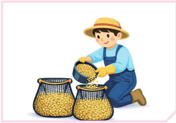
미소독종자 망사포대 옮겨 담기 * 포대단위 : 10kg당 1포대

* 소독 온도 및 시간 미준수 시, 발아율·소독효과가 떨어질 수 있음을 참고