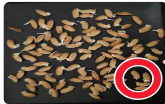
최아율 80~85% / 파종 적기