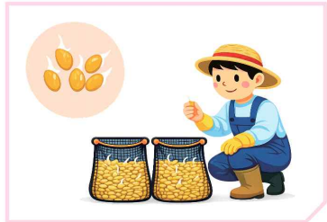
물 교체 후 20~30°C에서 최아* 확인 * 최아상태 : 1~2mm, 80%이상