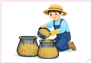
미소독종자 망사포대 옮겨 담기 * 포대단위 : 10kg당 1포대

* 소독약의 종류에 따라 약 30°C에서 24~48시간 경과 후 새로운 물로 교체하여 지속 침지