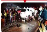
44대 추돌 - 사상자 37명 (사망 1명, 중경상 36명/2023. 1. 15)