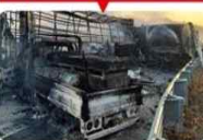
44대 추돌 - 사상자 39명 (사망 7명, 부상 32명/2019. 12. 14)