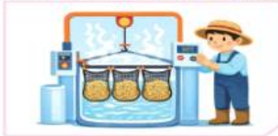
물 온도 60°C에서 10분간 담그기 * 비율 : 20kg당 물 200L