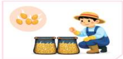
물 교체 후 20~30°C에서 최아* 확인 * 최아상태 : 1~2mm, 80%이상