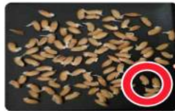
최아율 80~85% / 파종 적기