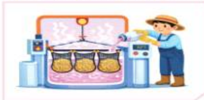
소독약액 24~48시간 침지 * 물 온도 30~32°C 유지