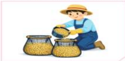
미소독종자 망사포대 옮겨 담기 * 포대단위 : 10kg당 1포대

* 소독약의 종류에 따라 약 30°C에서 24~48시간 경과 후 새로운 물로 교체하여 지속 침지