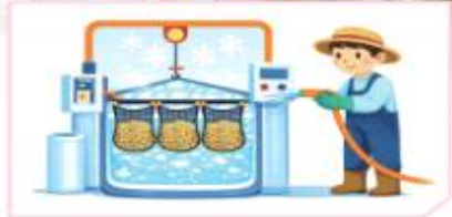
찬물에 10분 이상 식히기