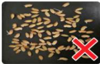
최아율 50~60% / 파종하면 안됨