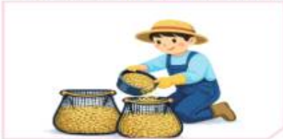
미소독종자 망사포대 옮겨 담기 * 포대단위 : 10kg당 1포대

* 소독 온도 및 시간 미준수 시, 발아율·소독효과가 떨어질 수 있음을 참고